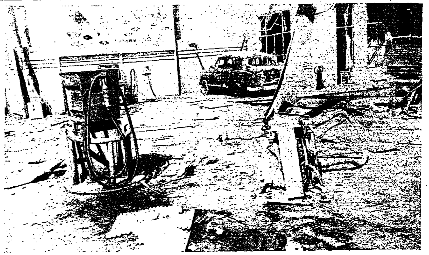
محطة البنزين كما بدت بعد تدميرها